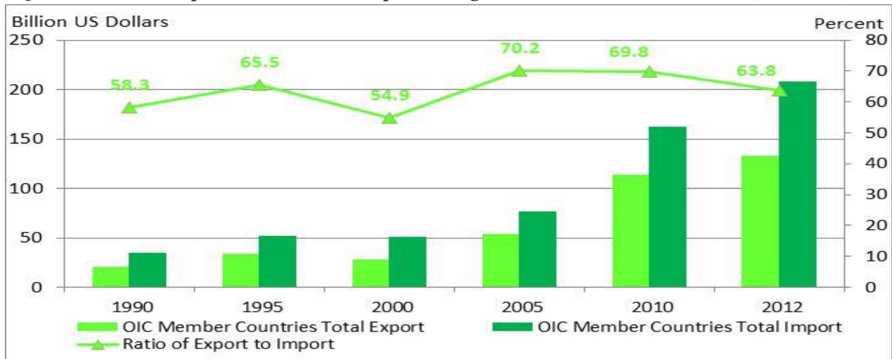
Figure 1 : Total de la part du commerce des produits agricoles de l'OCI dans le monde (1990-2012)

Source : Perspectives 2015 du COMCEC sur l'agriculture.